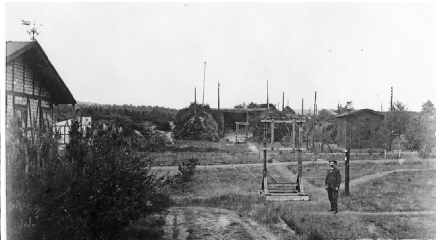
Geschütz-Schießstand, Aufnahme 1889