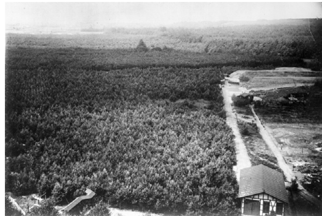
Geschützschuppen und Schießstand, Aufnahme 1889

Der um 1889 auf dem Areal des Schießstandes errichtete Flakbunker diente früher als Ziel für die Kanonen. Hier wurde aus einer Entfernung von 200-300 m auf den Bunker geschossen. Die Einschläge im Beton zeugen von der Wucht der aufschlagenden Munition.